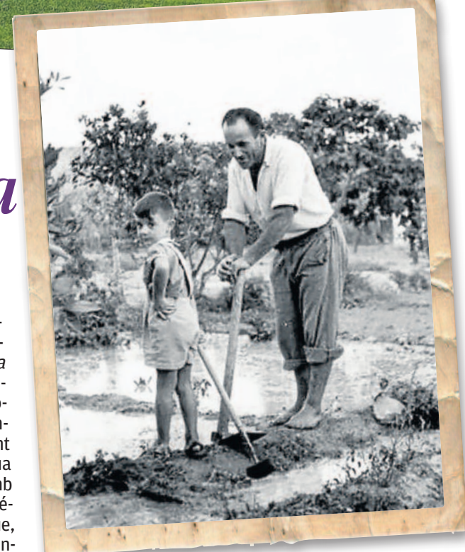
Regant a manta en terrenys situats al Garbinet, on hui es troba el Centre Comercial Gran Via, c. 1953.

guatinent» amb forts interessos especulatiu que mantingué en tensió constant el repartiment de l'aigua provinent del pantà. El trencament de la presa en 1697 –amb greus conseqüències per a l'Horta i que no va ser reparada fins el 1738– ha estat per a molts un atemptat promocionat per aquests importants grups de poder.