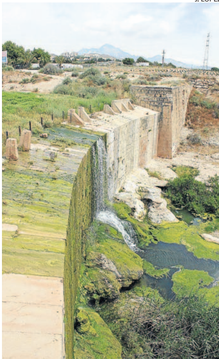
Assut de Sant Joan.