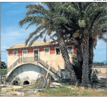
El Pantanet de Mutxamel, punt d'inici de l'actual sistema de reg de l'Horta d'Alacant.

On comprar-lo? En llibreries i en el web https://Publicacions.ua.es